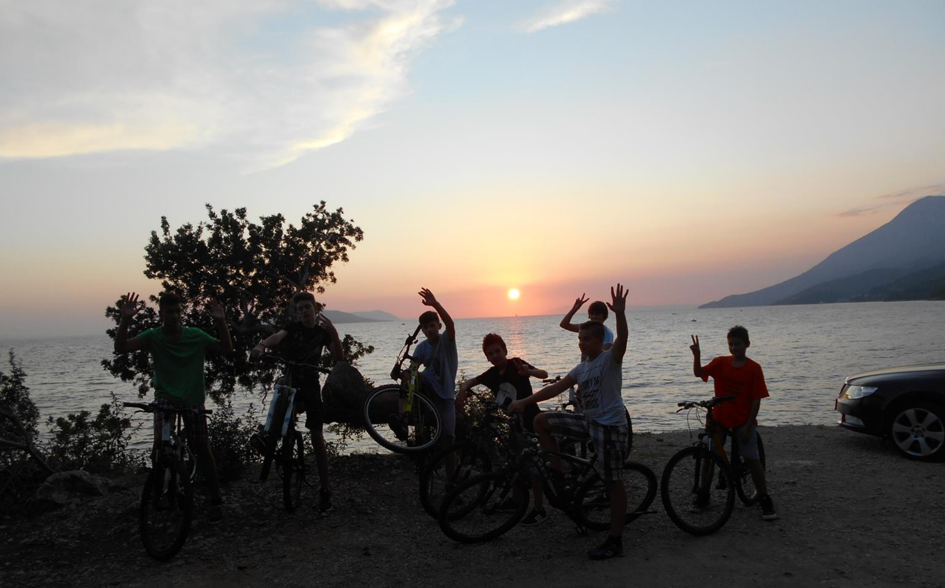
Maturalac Zaostrog – Dubrovnik – Dolina Neretve